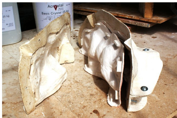
Chape de moule fine - Frédéric Vincent

L'Acrystal Prima est le produit idéal pour la réalisation de chapes de moules légères. L'absence de retrait évite les déformations de la chape au séchage. Même pour des chapes de grandes dimensions les renforts métalliques sont inutiles.