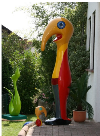
Haptikuss - 2 couches de peintures acryliques + 2 couches de vernis acrylique brillant - Silvia Baumer

ATTENTION: N'appliquer les produits de finition que sur des produits parfaitement secs (minimum 72 heures de séchage) afin d'éviter les problèmes de cloques.